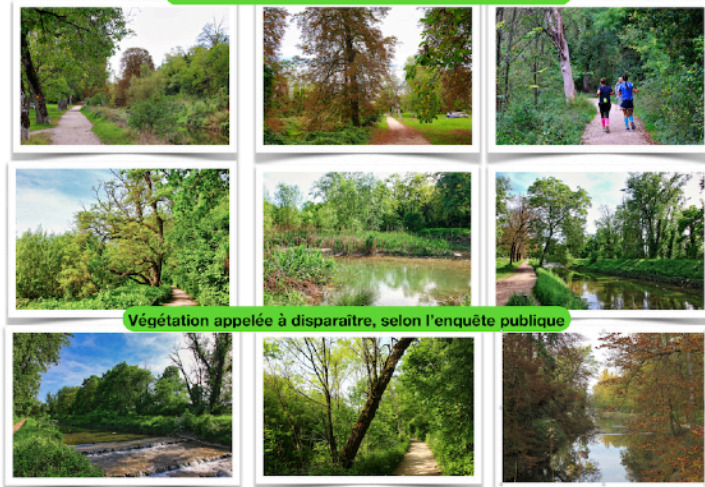
Végétation appelée à disparaître, selon l'enquête publique

L'OCAN (Office cantonal de l'agriculture et de la nature) a annoncé que les arbres seraient abattus sur une grande échelle dans le but d'élargir le lit de la rivière lors du projet de renaturation 4e étape - entre le pont couvert à Lully et la frontière avec Saint-Julien-en-Genevois. Face à cette proposition consternante de déboisement massif la commune de Bernex n'a pas réagi.